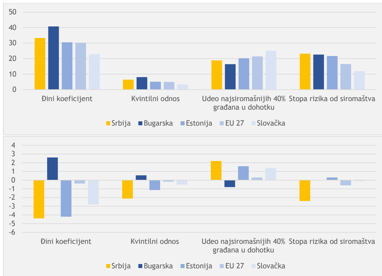
Dijagram 1: Indikatori dohodne nejednakosti za Srbiju i odabrane države u 2019. godini (na vrhu) i promene u periodu 2015/2018. 4 (na dnu)